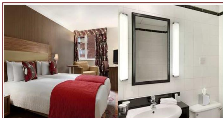
* Hilton London Olympia、ハイストリートケンジントン(イメージ)