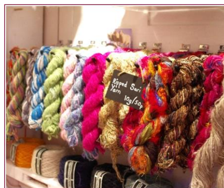
*手芸屋さん(イメージ)