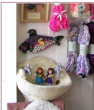
*手芸屋さん(イメージ)