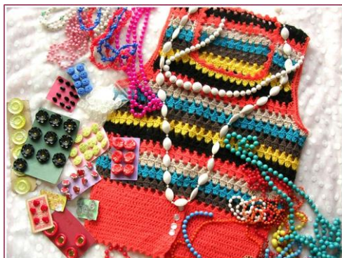
*あけつん！さんが以前ロンドン蚤の市で買われたアイテム

2013年『子どものための手作り素材集 KID'S ROOM(DVD付き)』(翔泳社刊)出版 主な掲載誌「Dolly*Dolly」(グラフィック社)、「ドールファッションスタイリング」(誠文堂新光社)、 「うさぎ小物づくり帖」(誠文堂新光社)など多数。ホームページ http://aketsun.com/